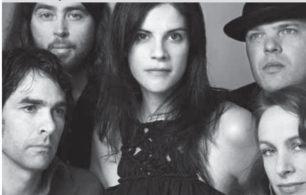
16.5. boss hog, rote fabrik, zürich, 21.00