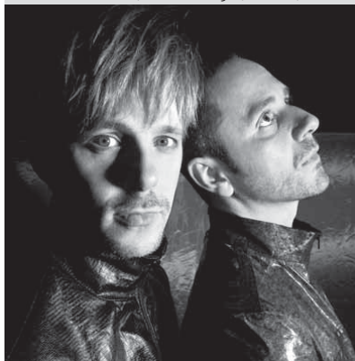
9.5. booka shade, rohstofflager, zürich, 23.00