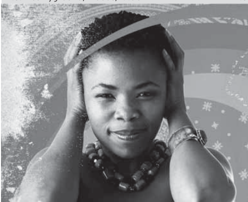
17.5. freshlyground, moods, 19.00