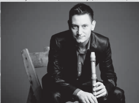
17.5. musikkollegium winterthur, maurice steger, tonhalle zürich, 11.00