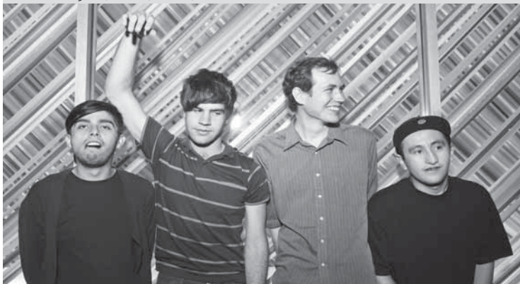
26.5. abe vigoda, stall 6, zürich, 22.00