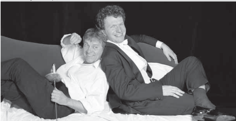
1. &amp; 2.5. engel im kopf, theater ticino, 20.30