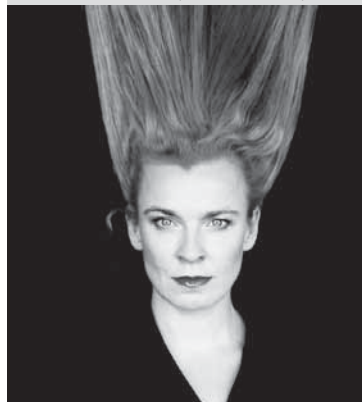
7. - 9.5. tina teubner, theater ticino, 20.30